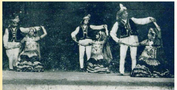
પ્રથમ યુવક મહોત્સવ પ્રસંગે સમૂહનૃત્યની એક જલક