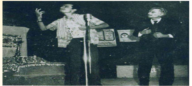
પ્રથમ યુવક મહોત્સવ પ્રસંગે વજૂ કચેલ નાટકોમાં પ્રથમ આપેલ ' બી. બી. શિવપદ ' નાટકનું એક દર્શન