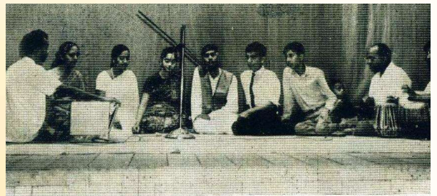
પ્રથમ યુવક મહોત્સવ પ્રસંગે સમૂહગાનનું એક દર્શન